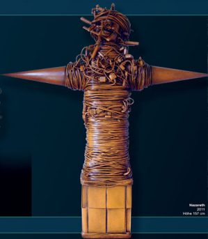
Nazareth 2011 Höhe 157 cm