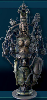
Sammara 2006 Höhe 205 cm